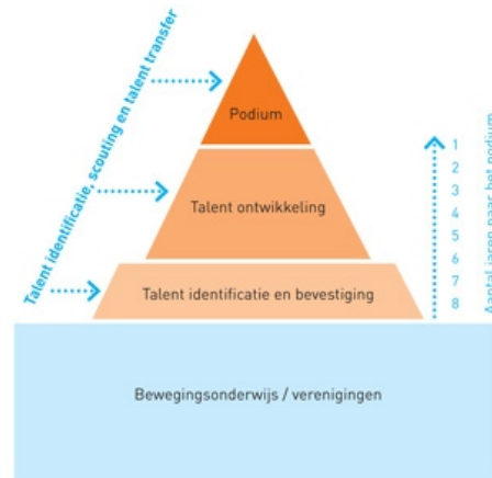
Figuur 1. Talenterkenning NOC*NSF

Talenterkenning of ook wel talentidentificatie en talentbevestiging is hierbij de eerste stap. In Nederland vindt de eerste kennismaking met sporten plaats binnen het (basis)onderwijs, het gezin of bij de sportclubs. Essentieel hierbij is dat de kinderen vooral het plezier van sport ervaren. Daarnaast is het van belang dat kinderen leren bewegen, de basisvormen van bewegen worden aangeboden en dat zij 'proeven' en kennismaken met zoveel mogelijk verschillende sporten. Deze stevige basis, die veelal moet plaatsvinden rond de basisschooleeftijd, maar ook zeker doorloopt na deze periode (zie figuur 1), moet er uiteindelijk aan bijdragen dat kinderen, ouders, vakleerkrachten, trainers en andere begeleiders aanleg en mogelijke sportvoorkeur spelenderwijs leren verkennen en ontdekken. Zo wordt er een basis gecreëerd die van meerwaarde is voor een levenslange (top)sportloopbaan.