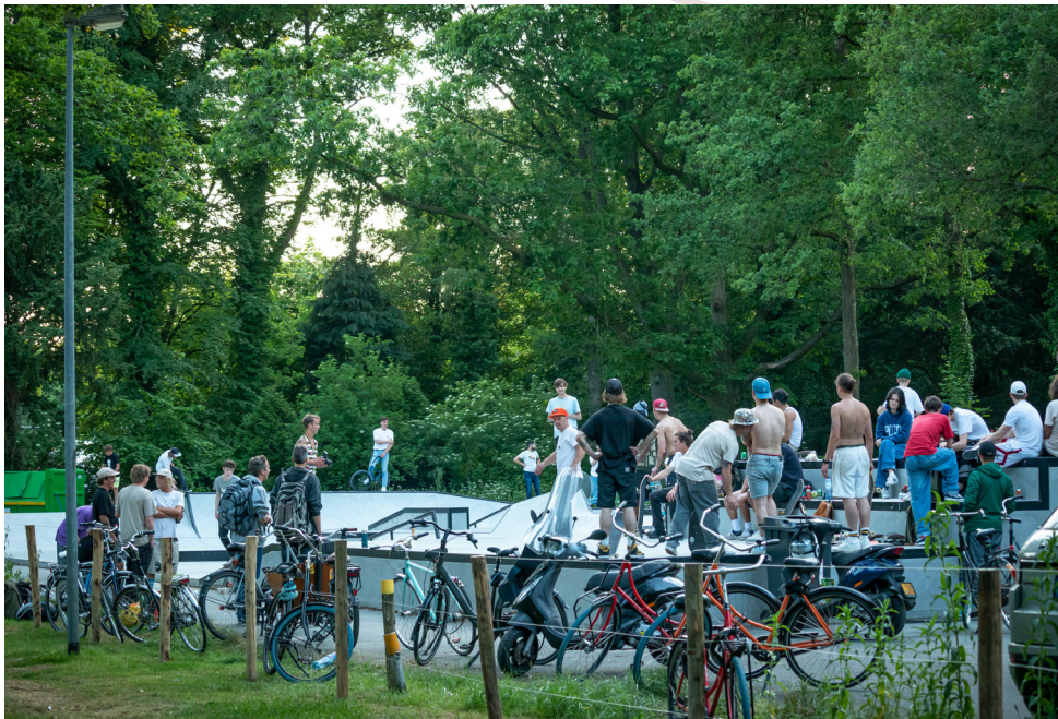
Afbeelding 10: Opening skatepark Stadspark

We onderzoeken of we een tijdelijke 'Do-It-Yourself' (DIY)-plek in Groningen kunnen toestaan, waar skaters zelf kunnen bouwen en metselen aan een skatepark. De regelgeving is hierbij een aandachtspunt. Skateparken moeten officieel worden gekeurd door het landelijk keuringsinstituut.