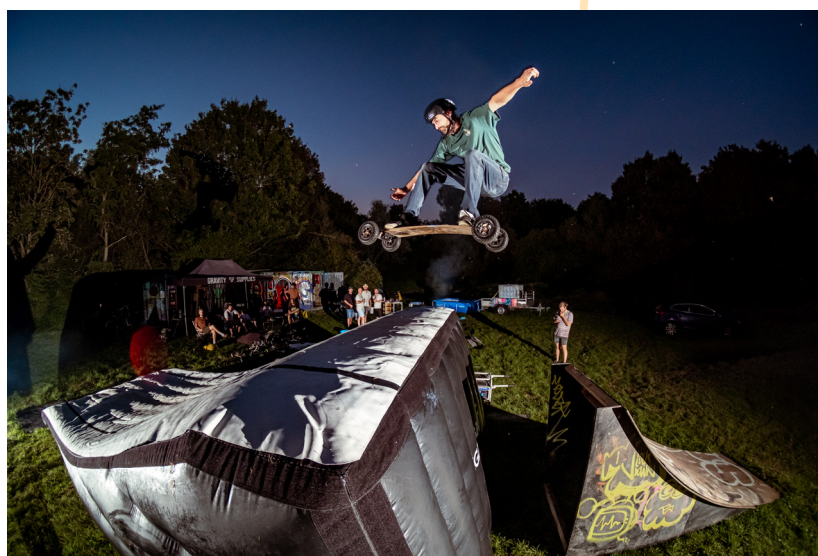
Afbeelding 4: mountainboarder in actie

De diverse Urban Sports-kartrekkers onderschrijven dat er overeenkomsten zijn tussen de disciplines, maar er zijn ook zeker verschillen. We willen de gezamenlijke kracht van Urban Sports zo goed mogelijk benutten, maar er moet ook aandacht zijn voor de verschillen in wensen en behoeften tussen de disciplines.