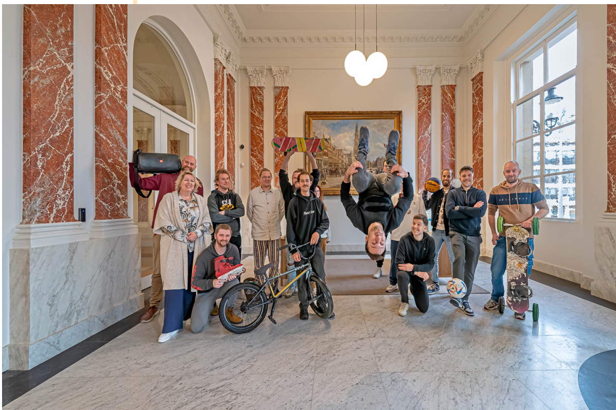
Afbeelding 3: officiële bekrachtiging Urban Sports Netwerk

In de komende hoofdstukken wordt uitgelegd wat we onder Urban Sports verstaan, wat de waarde daarvan is en waarom we juist nu een Urban Sports Agenda nodig hebben. Vervolgens schetsen we een droombeeld als stip op de horizon, waarna we de verschillende actielijnen die hieruit voortkomen uiteenzetten. Hierna gaan we dieper in op de werkwijze. We sluiten af met een financieel hoofdstuk.