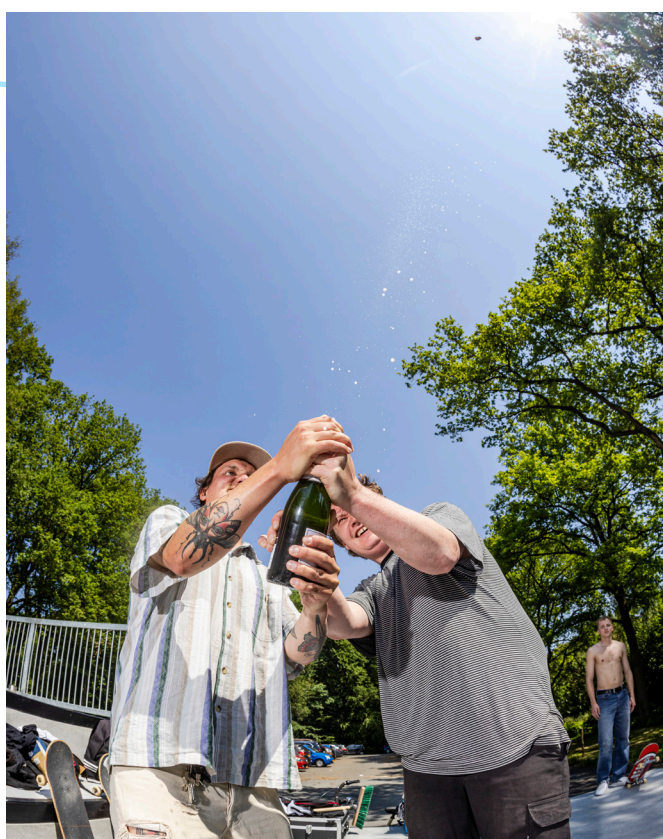
Afbeelding 15: opening stedelijk skatepark Stadspark door initiatiefnemers

Tot slot is ook cofinanciering vanuit het Urban Sports Netwerk een mogelijkheid om de budgetten te vergroten. Fase 2 van het stedelijk skatepark is hier een goed voorbeeld van. Rollend Groningen, een collectief van skaters, BMX'ers, inliners en steppers, is samen met een fondsenwerver bezig om de helft van het benodigde bedrag voor de tweede helft van het skatepark bij elkaar te krijgen. Deze constructie is voor de toekomst wellicht kansrijk om meer aanspraak te maken op fondsen en subsidies.