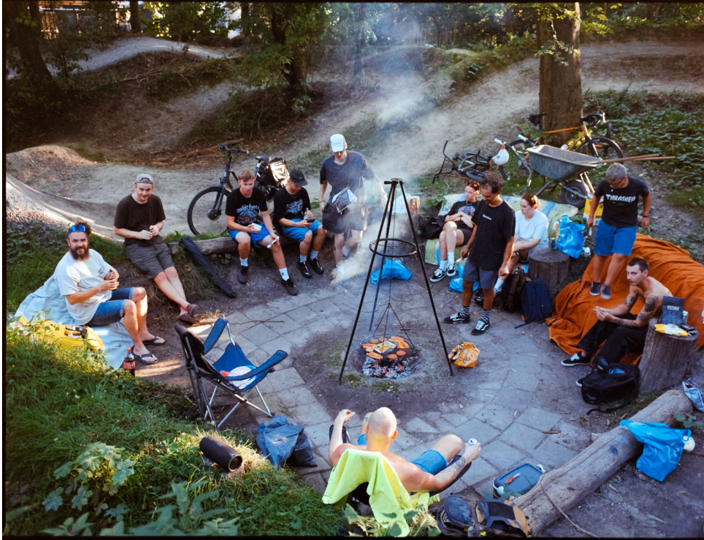
Afbeelding 13: zomeravond in het Dirt Park Beijum