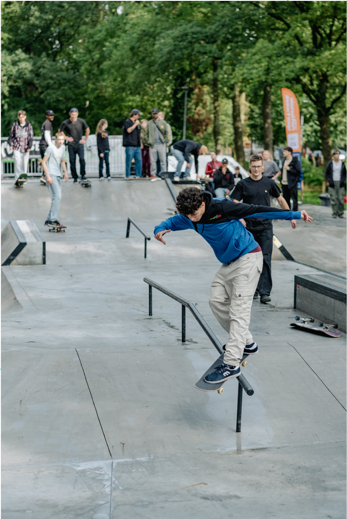
Afbeelding 16: Urban Sports Event 2023