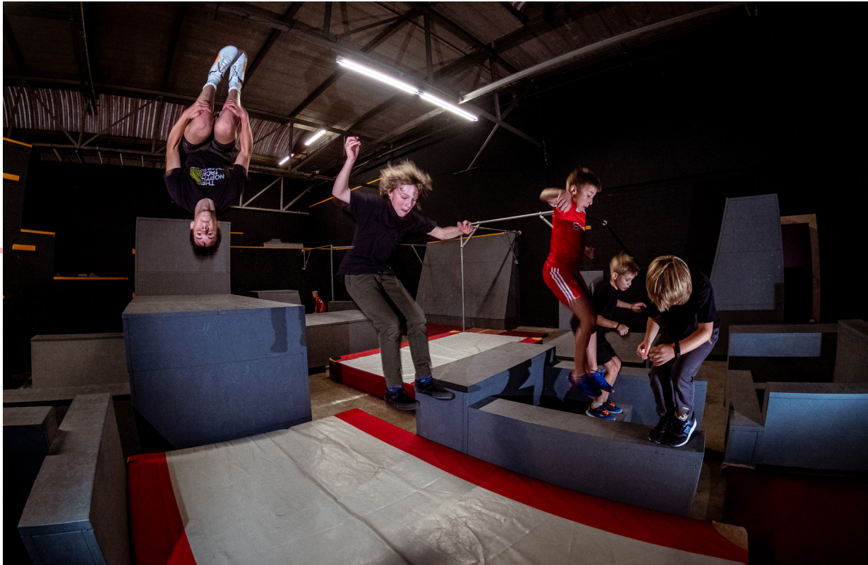
Afbeelding 11: The Spot (freerunning) Groningen