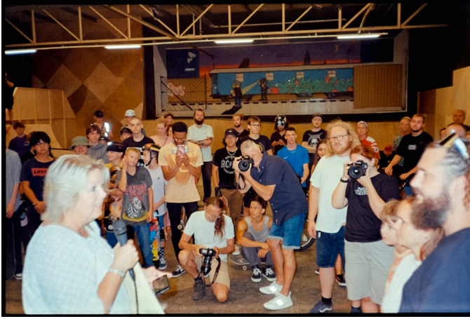
Afbeelding 6: opening van skatepark Colosseum