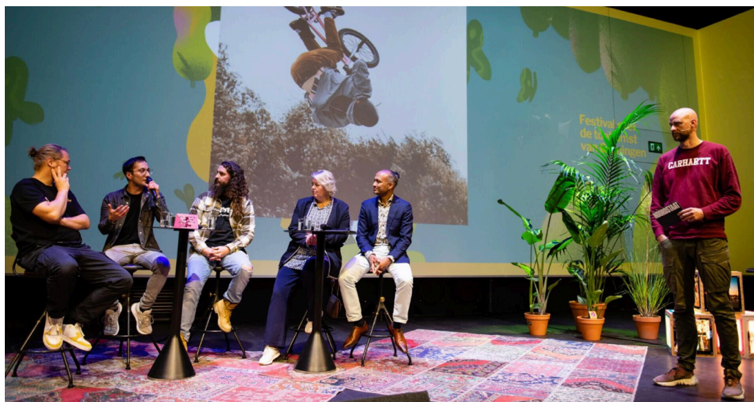
Abeelding 2: gesprek over Urban Sports tijdens Let's Gro 2022

We werkten al steeds meer samen met Urban Sporters, maar we willen Urban Sports nog beter borgen binnen ons beleid. Met de ontwikkeling van de Urban Sports Agenda geven we hier uitvoering aan. Als gemeente Groningen zijn we in de lead om de voortgang van de agenda te bewaken. Veel van de acties voeren we echter samen met de Urban Sporters uit. Er is dus sprake van een gedeelde verantwoordelijkheid.