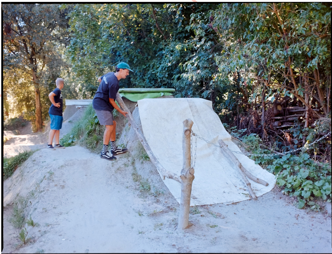
Afbeelding 14: Dirt Park Beijum

In de Urban Sports Agenda hebben we concrete acties geformuleerd, voor de korte en lange(re) termijn. De Urban Sports Agenda is een dynamisch stuk, waar we regelmatig over in gesprek gaan met het Urban Sports Network. Deze agenda stellen we dan ook niet vast voor meerdere jaren, maar is in beweging en wordt regelmatig bijgesteld. In ieder geval om de twee jaar evalueren we met het gehele Urban Sports Network waar we staan, op welke punten meer inzet is vereist en waar mogelijk nieuwe kansen liggen. Het bewaken van de voortgang van de agenda ligt bij de gemeente. Veel van de acties vereisen echter inzet vanuit zowel gemeente als het Urban Sports Network. Er is sprake van gedeelde verantwoordelijkheid.